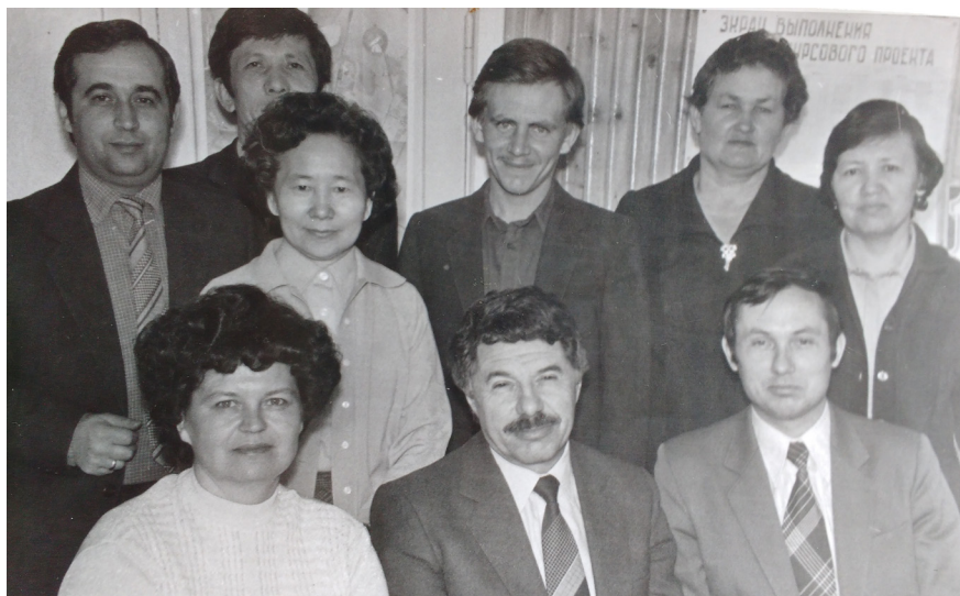
Кафедра економіки, організації будівництва та будівельних матеріалів ВТУЗа. Теміртау, Казахстан, 1982 р.