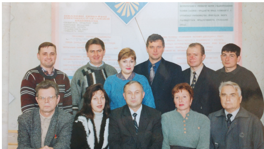
З колегами по кафедрі економіки та управління будівництвом. Вінниця, ВДТУ, 1998 р.