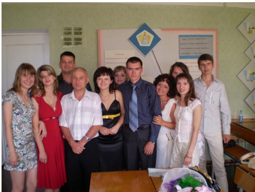
Фото на згадку з випусниками кафедри менеджменту будівництва. ВНТУ, 2008 р.