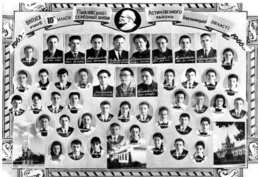
Випуск учнів 10 класу Пилявської середньої школи, 1966 р.