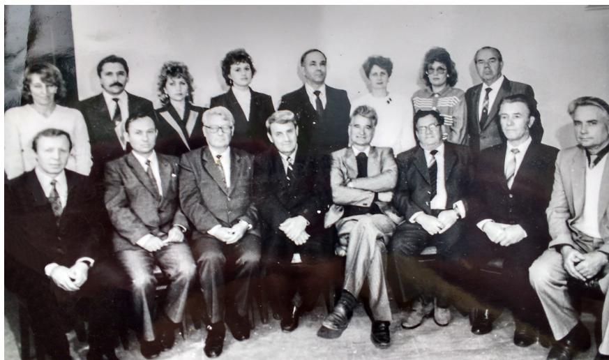
Склад кафедри технології будівельного виробництва. Вінниця, ВПІ, 1987 р.