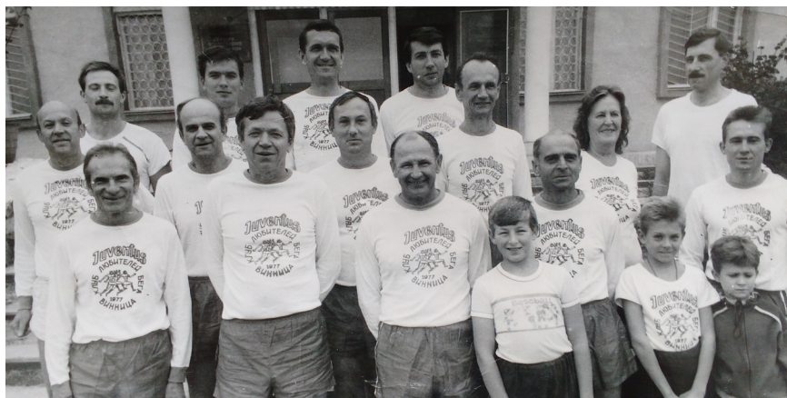
Спортивне захоплення – член клубу любителів бігу «Ювентус». Вінниця, 1989 р.