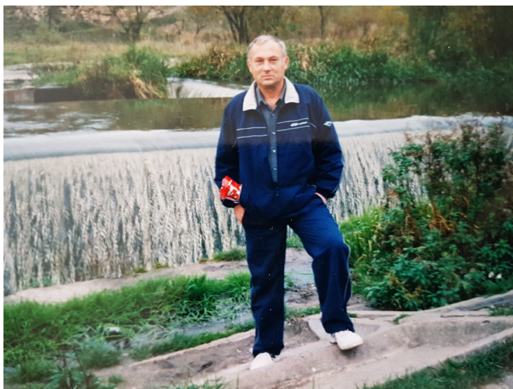
На відпочинку в санаторії м. Сатанів. Хмельницька обл., 2004 р.