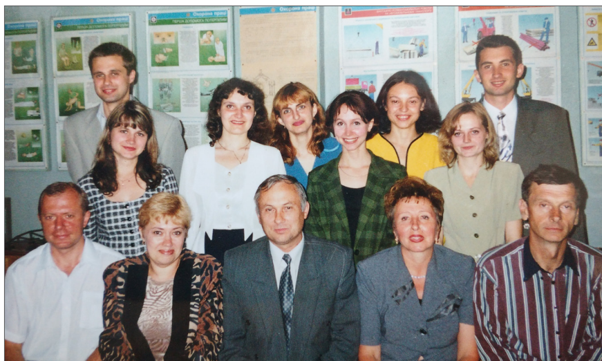
Після захисту дипломних проектів. ВДТУ, 2001 р.