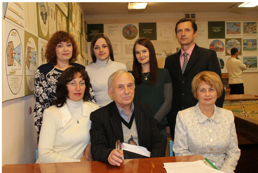
Склад секції менеджменту будівництва кафедри БМГА. ВНТУ, 2015 р.