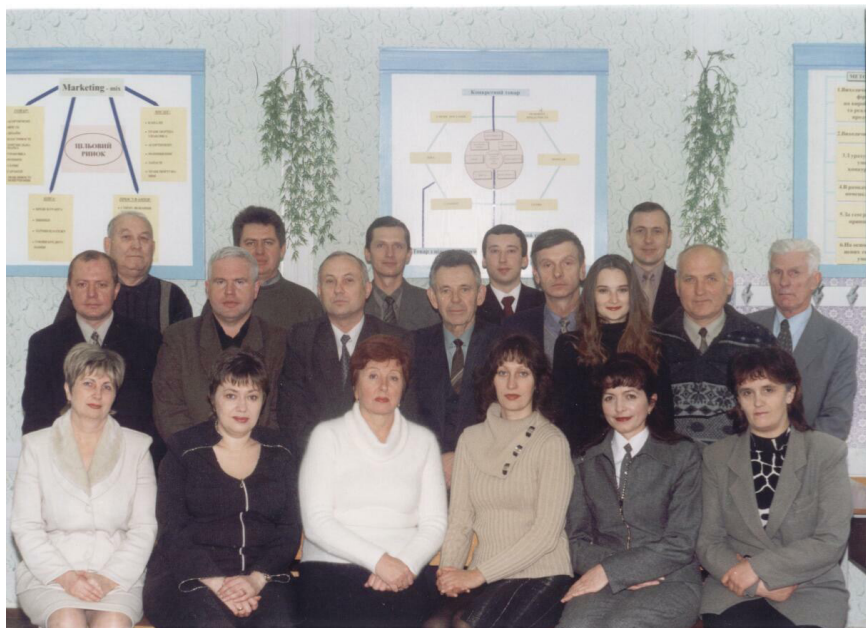
Кафедра менеджменту будівництва, охорони праці та безпеки життєдіяльності. ВНТУ, 2004 р.