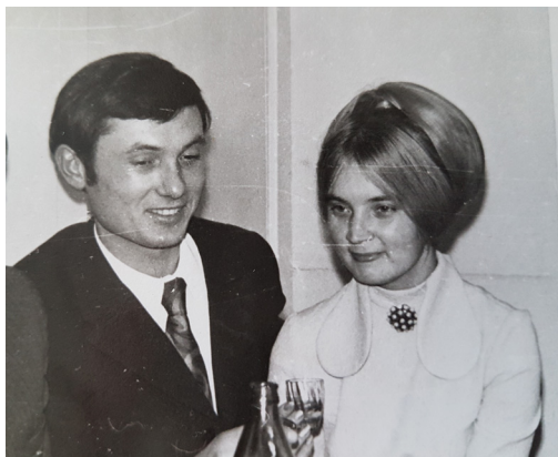
В день весілля. Караганда, 1974 р.