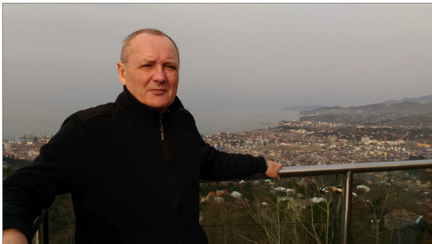
На відпочинку у Грузії, м. Батумі, 2017 р.