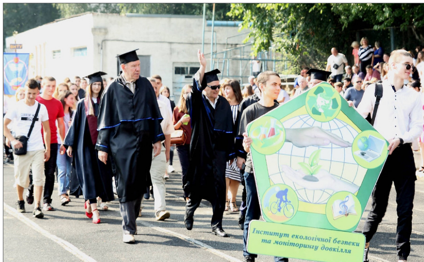
На урочистій посвяті в студенти ВНТУ майбутніх екологів, 2019 р.