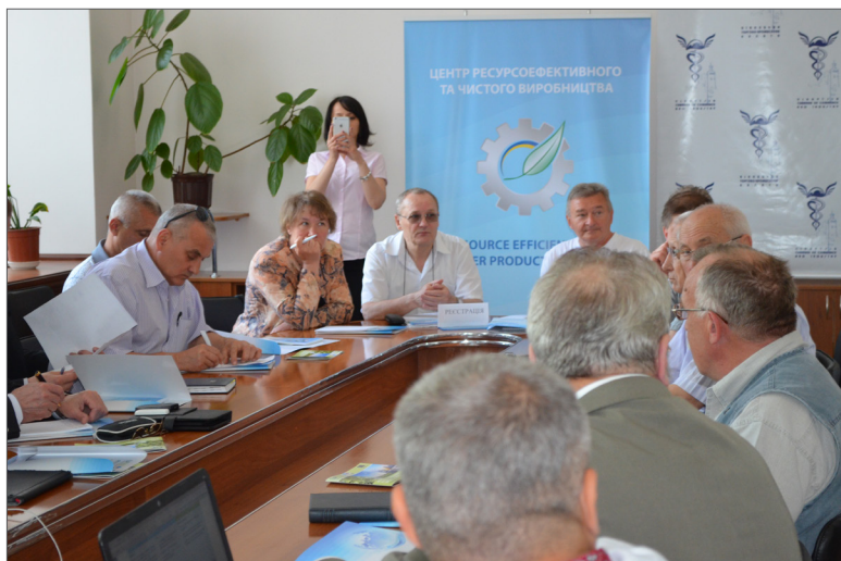
Діалог державних управлінців, підприємців та науковців Вінницького регіону з представниками Університету Організації Об'єднаних Націй по впровадженню в Україні проекту «Ресурсоефективне та чисте виробництво», м. Вінниця, 2015 р.