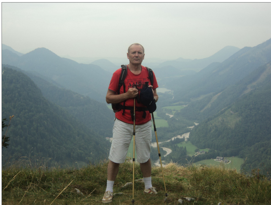
На відпочинку в Альпах, 2013 р