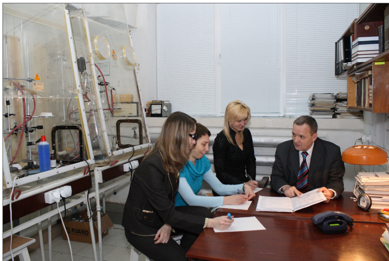
З молодими науковцями в науково-дослідній лабораторії технологічних процесів та синтезу напівпродуктів кафедри хімії та хімічної технології ВНТУ, 2009 р.