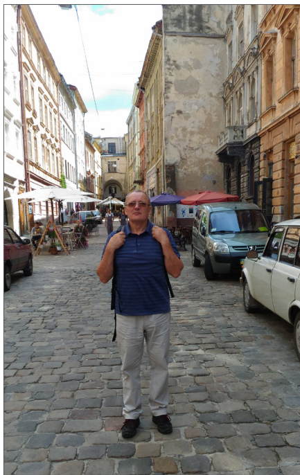
На екскурсії історичним Львовом, 2018 р.