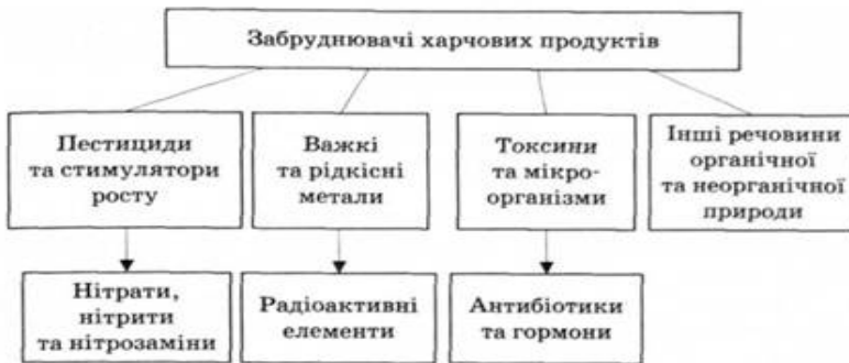
Рис. 8.1. Джерела забруднення харчових продуктів

Екологія харчування охоплює всю систему харчування, враховуючи його вплив на здоров'я, довкілля, соціальні й економічні аспекти життя людини. Вона включає і засоби аграрного виробництва – механізацію, енергетику, добрива, пестициди, і компоненти харчового ланцюга – виробництво, вирощування продукції, транспортування, зберігання, перероблення, пакування, торгівлю, готування, споживання й утилізацію відходів, від чого залежить якісний склад не лише корисних поживних речовин, але й потрапляння шкідливих речовин (рис. 8.1) у продукти харчування.