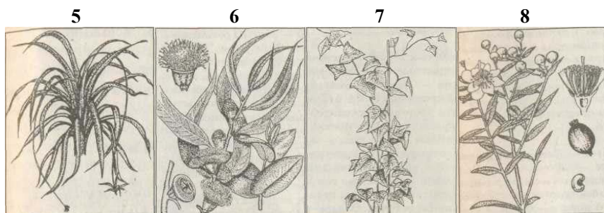
Рис. 6.1. Кімнатні рослини:

1-Алоє деревовидне ; 2- Каланхоє строкате; 3- Розмарин лікарський; 4- Лимон звичайний; 5- Хлорофітум; 6 – Евкалипт сферичний; 7- Плющ звичайний; 8- Мирт звичайний