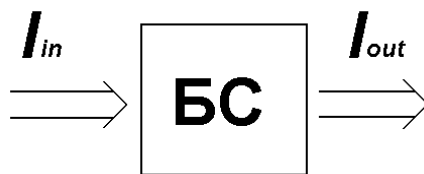
Рисунок 2.1 – Біологічна система (БС) як перетворювач потоків енергії

міну енергією і речовиною з зовнішнім середовищем. Можна сказати, що БС існують (живуть) на тлі потоків енергії як деякий об'єкт, який перетворює вхідні потоки енергії I_{in} у вихідні I_{out} . При цьому БС змінює не тільки інтенсивність потоків енергії, але і саму номенклатуру їх видів, а також і їх структуру. Взаємодію біологічної системи з довколишнім середовищем схематично показано на рис. 1 [2].