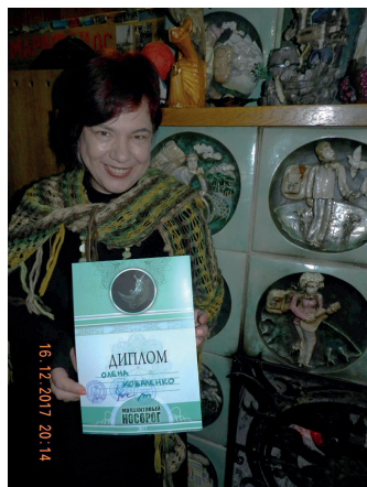
Номінантка Всеукраїнського конкурсу одного вірша «Малахітовий носоріг»