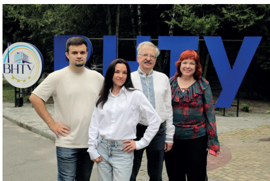
Команда розробників та адміністраторів системи JetIQ VNTU