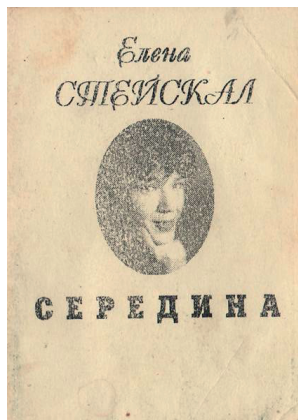
Перша збірка поезій Олени Коваленко, 1997 рік