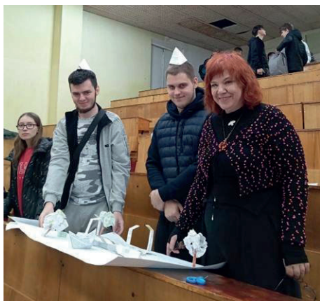
Організація інтеграції програмних продуктів: ділова гра зі студентами