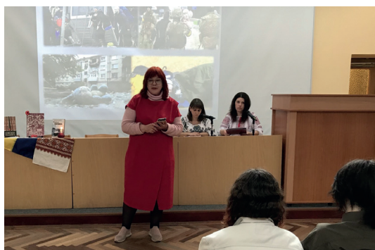
Олена Олексіївна з авторською поезією про війну та її героїв, на просвітницькому заході університетської бібліотеки