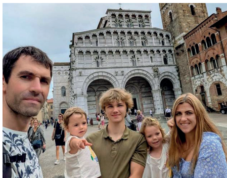
Сім'я доньки Аліси, фахівця ІТ, мама трьох дітей