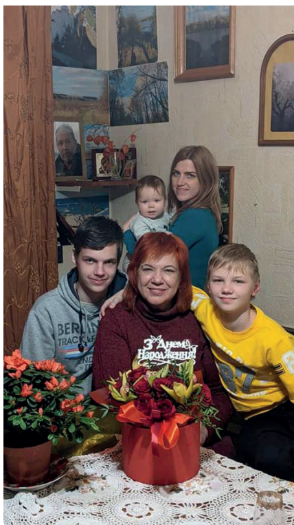
З донькою та онуками. Світлина мирного часу