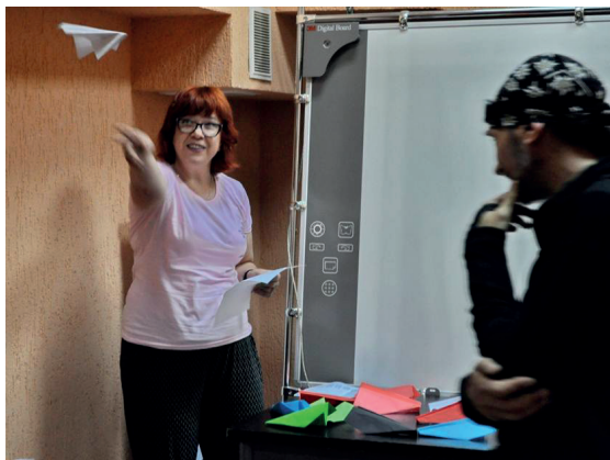
Перфоменс на вірш «Літачки мої» – поетичний батл у ВОУНБ ім. В. Отамановського