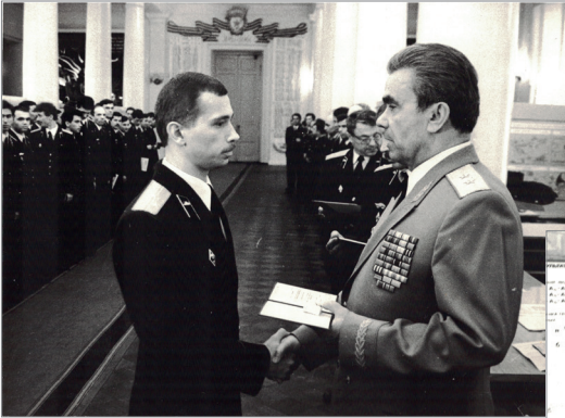
На врученні диплому у Військовій академії бронетанкових військ, 1988 р.