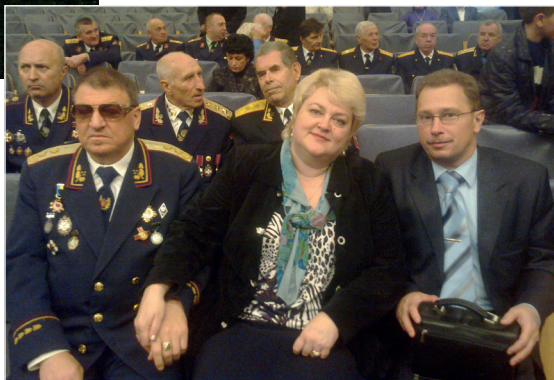
На урочистостях з нагоди 10-річчя Міжнародної громадської організації «Українське козацтво». Житомир, 2011 р.