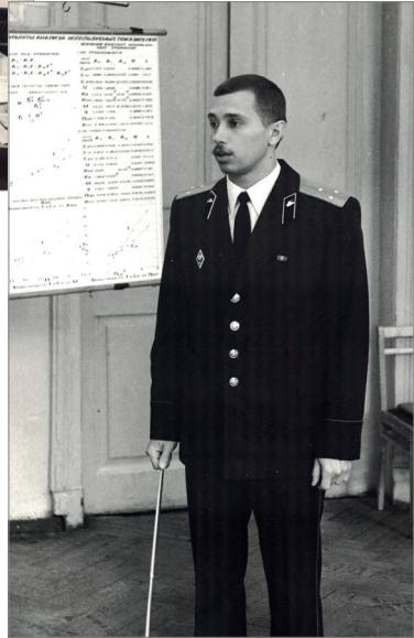
Захист кандидатської дисертації у Військовій академії бронетанкових військ, 1991 р.