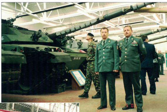
Зал бронетанкової техніки

Королівський музей армії та військової історії. Бельгія, Брюссель, 2003 р.