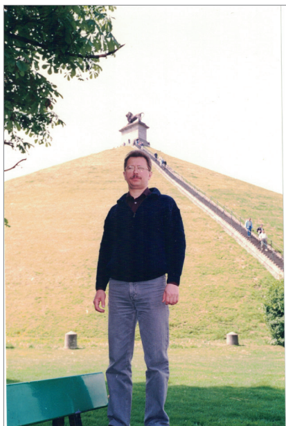
Біля пагорба Лева у Ватерлоо - місця фінальної поразки Наполеона І. Бельгія, 2003 р.