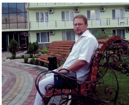
Відпочинок у м. Хмільнику на Вінниччині, 2018 р.