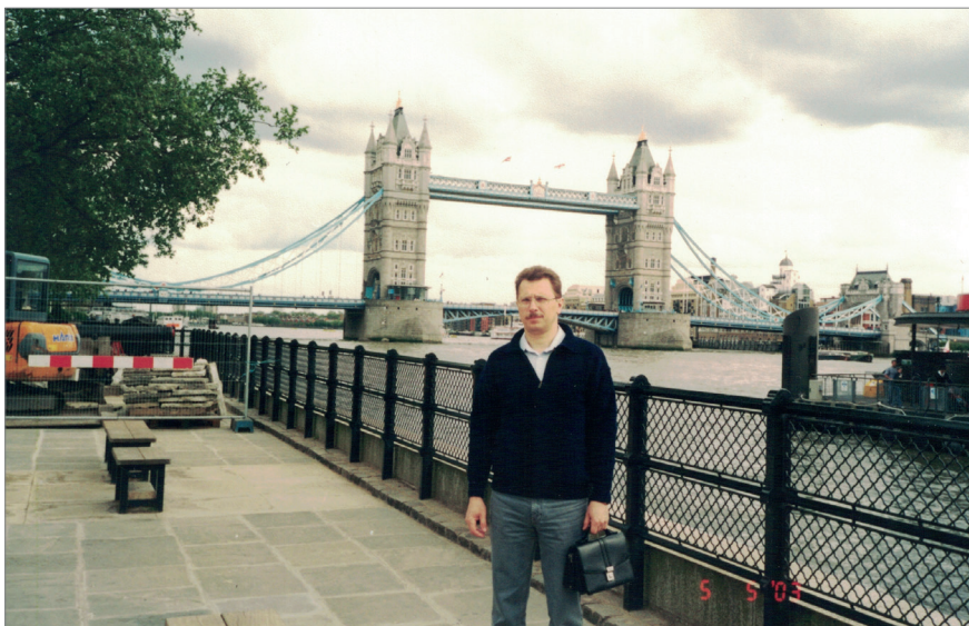
Тауерський міст. Великобританія, Лондон, 2003 р.