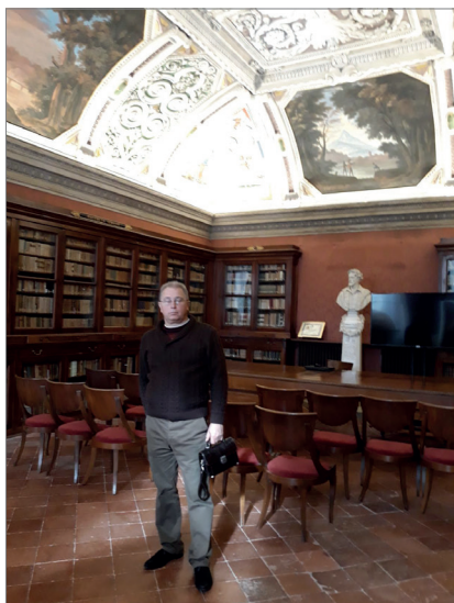
У науковій бібліотеці міста. Італія, Бергамо, 2019 р.