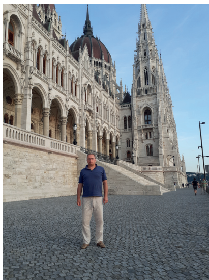
Біля Будівлі парламенту Угорщини. Будапешт, 2020 р.