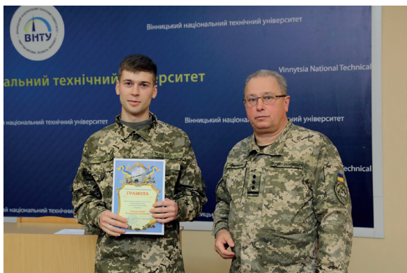
Вручення грамот на День захисників і захисниць України. Вінниця, ВНТУ, 2020 р.