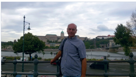
Будайський палац та Ланцюговий міст Сечені. Будапешт