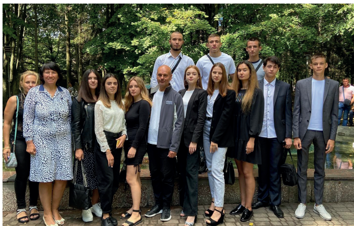
Попереду чотири роки трансформації від цікавих першокурсників до фахівців, які розуміють закони ринку та логіку інновацій