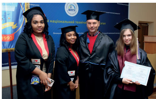
Академічна мить міжнародного виміру