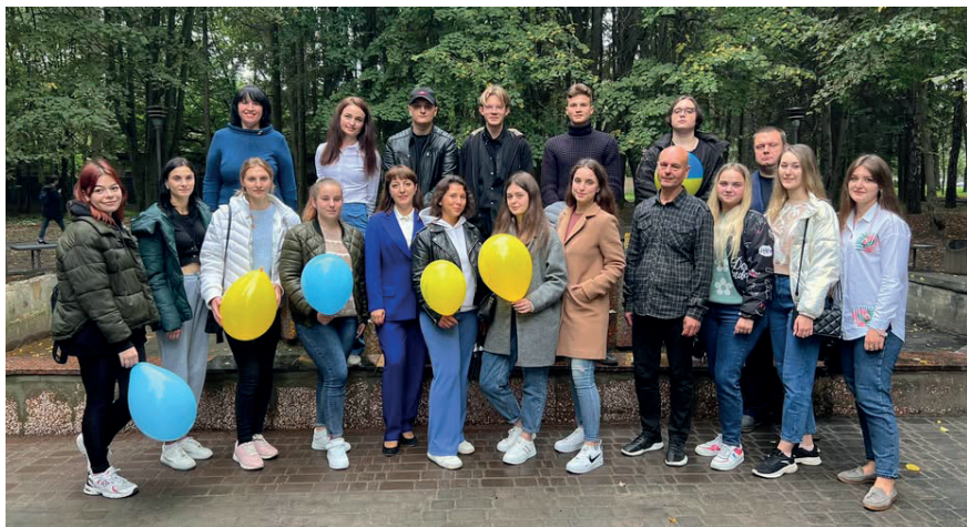
З викладачами та студентами кафедри фінансів та інноваційного менеджменту, 2023 р.