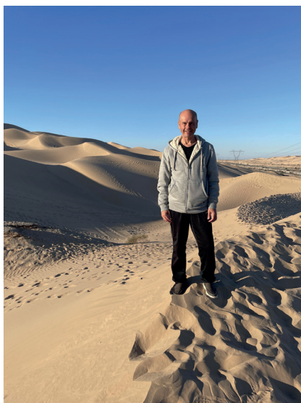
Серед дюн пустелі Мохаве