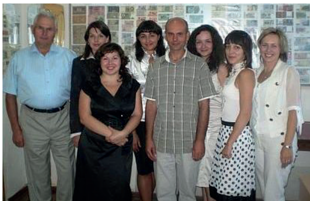
Колектив кафедри фінансів і кредиту, 2010 р.