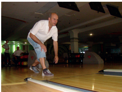
Оптимізація витрат: одна куля – мінус десять активів