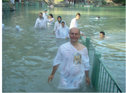
У святих водах Йордану