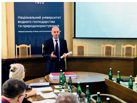
Виступ на засіданні спеціалізованої вченої ради НУВГП