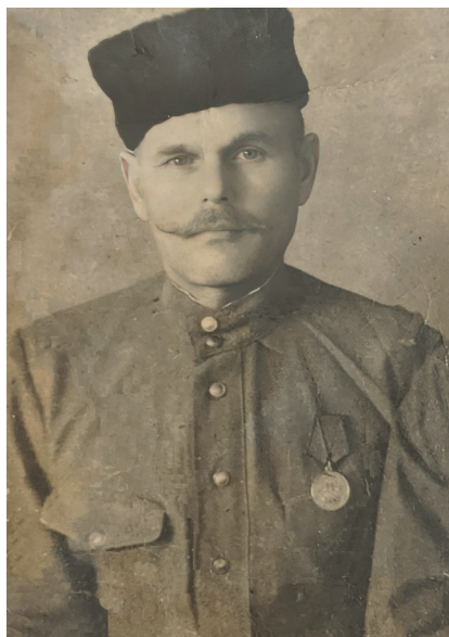
Дід Костя прожив вік – все ХХ століття