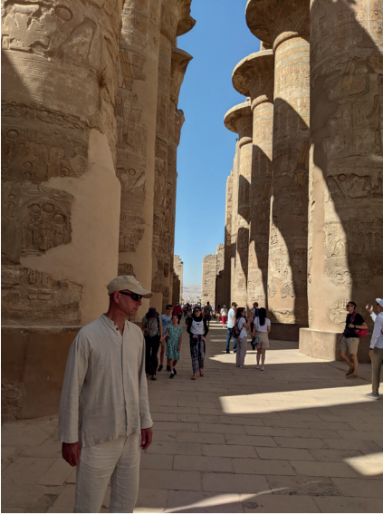
134 гігантські колони Карнакського храму створюють справжній кам'яний ліс, у якому людина відчуває себе піщинкою часу