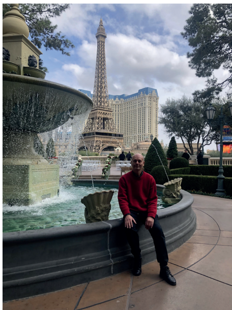
Paris Las Vegas. Економіка вражень – європейська архітектура інтегрована в американський розважальний бізнес