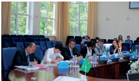
На конференції у Державному податковому університеті (м. Ірпінь)