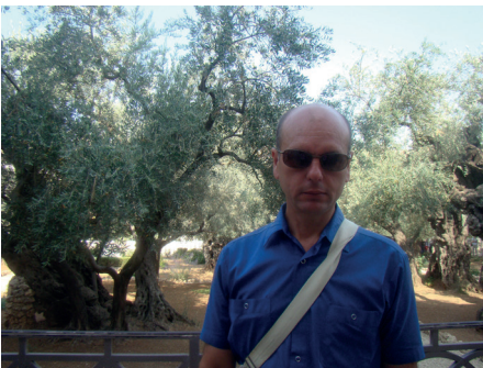
Гефсиманія. Ці оливи є живими свідками Небес на землі