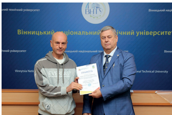
Ректор ВНТУ вручає Грамоту Вінницької ОВА за підготовку переможців II етапу Всеукраїнського конкурсу-захисту науково-дослідницьких робіт учнів-членів МАН України, 2025 р.