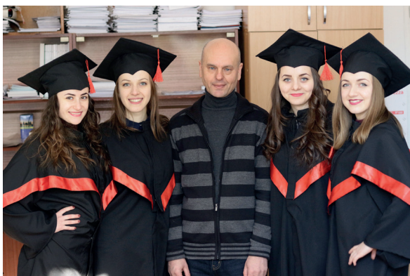
Поруч із випускниками – найкращий звіт про виконану роботу