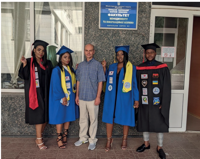
Успішна емісія нових фахівців – ринок фінансів поповнився кадрами з найвищим рейтингом надійності