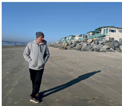
Узбережжя Тихого океану поблизу Сан-Дієго на кордоні США та Мексики