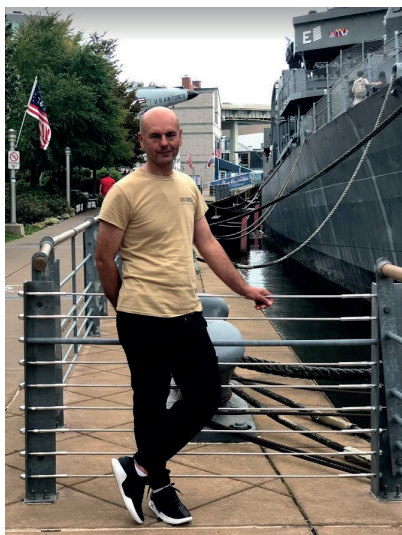
Naval & Military Park, Buffalo, New York, USA