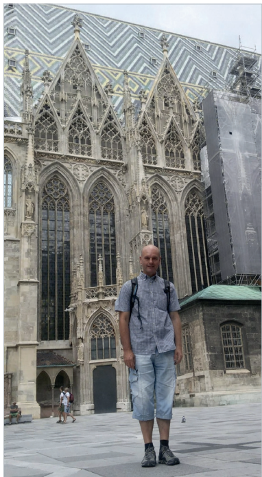
Stephansdom або просто Steffl – ажурна кам'яна біографія Відня