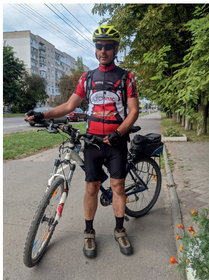
Професор. Велосипед. Баланс