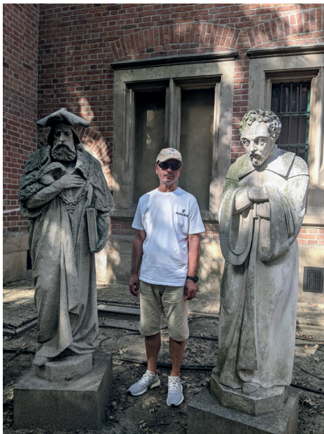
У товаристві колег із XIV століття Ягеллонський університет, Краків