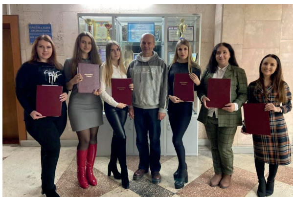
Професор і його найдаліший науковий проєкт – випускники