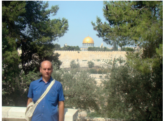
Храмова гора, Єрусалим, Ізраїль