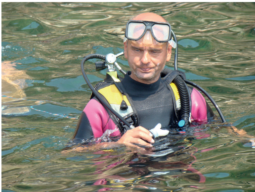
Дайвінг на Тарханкуті