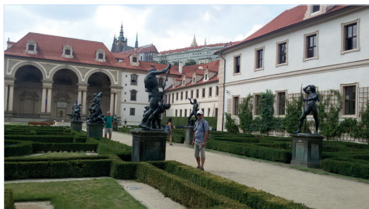
Вальдштейнський сад. Тут пристрасті застигли у метали. Прага