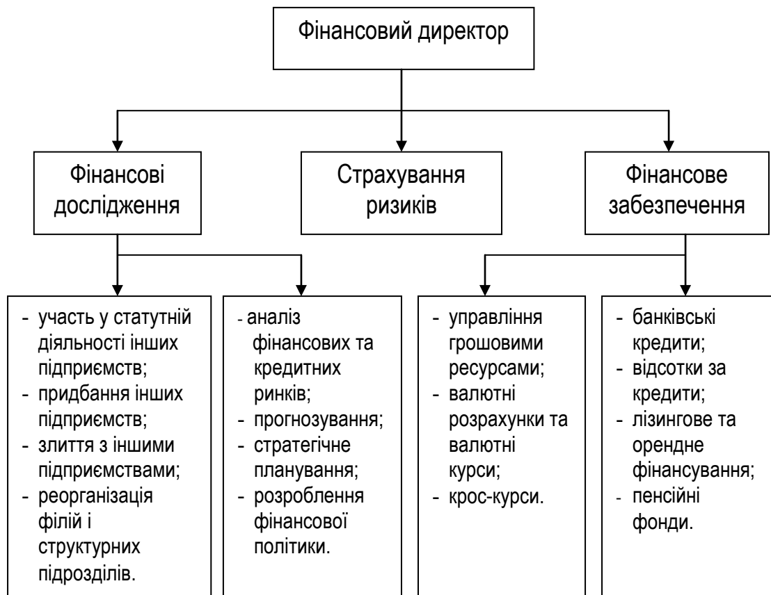
Рисунок 1.2 – Організація служби фінансового менеджменту

На основі теоретичних відомостей та фактичних даних об'єкта дослідження необхідно охарактеризувати: