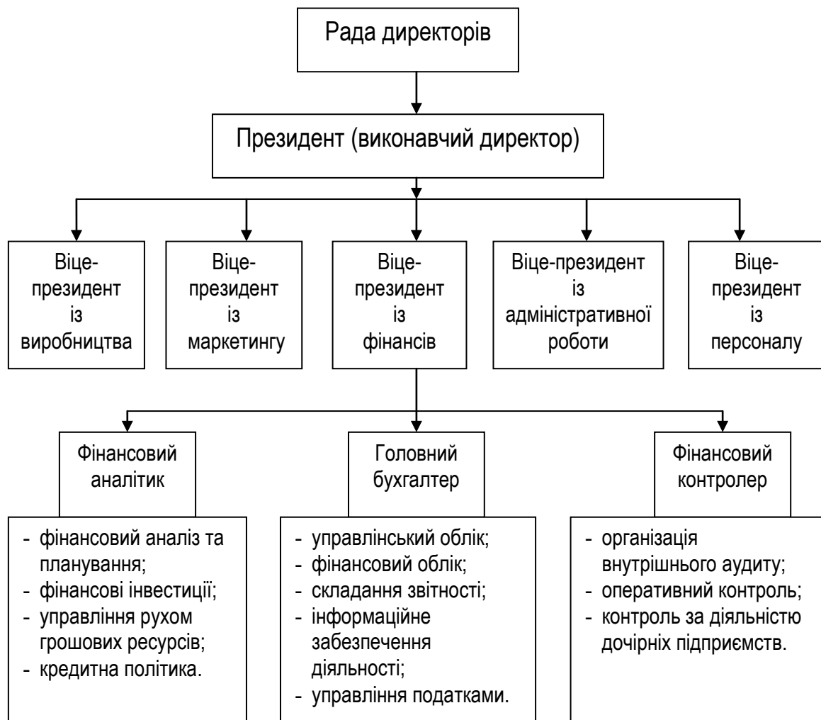
Рисунок 1.1 – Організаційна структура управління фінансами великого підприємства

Для характеристики організаційної структури служби фінансового менеджменту фінансово-промислових груп або холдингів (рис. 1.2) потрібно відзначити одну їхню суттєву рису – низький рівень децентралізації. Така особливість зумовлюється централізацією управління фінансів на рівні центрального апарату і потребою збереження повноважень приймати стратегічні рішення на найвищому рівні.