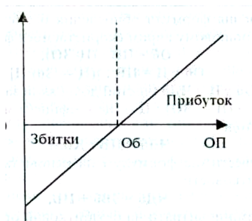
Рисунок 8.2 – Динаміка прибутку (збитку) залежно від обсягу виробництва