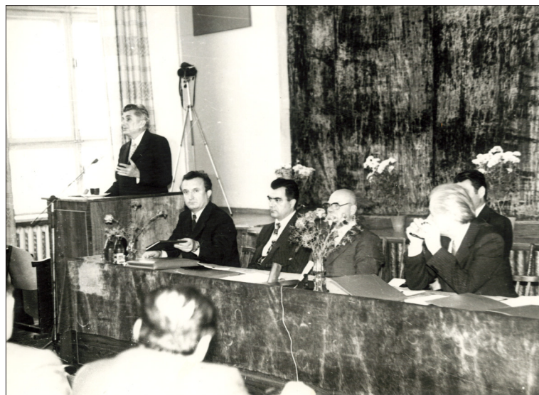
Заседание в ВПИ коллегии Минвуза Украины по проблемам науки, кадров и материально-технической базы в вузах. Выступает министр высшего и среднего специального образования УССР Г. Г. Ефименко