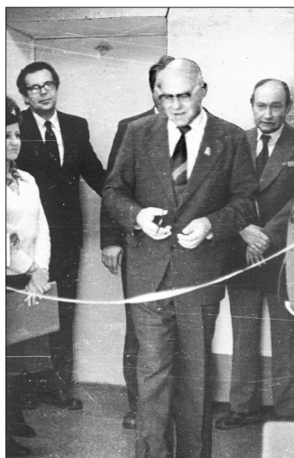
Открытие опытно-экспериментального завода и СКТБ «Модуль» ВПИ, г. Винница, 1977 г.