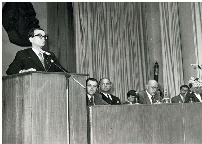
ВПИ, заседание Совета по кибернетике. Выступает академик АН СССР В. М. Глушков