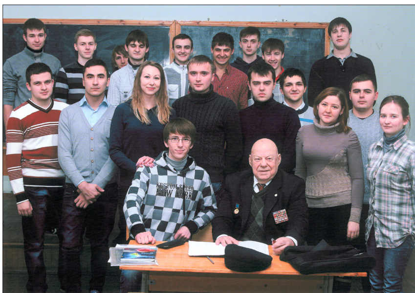
Фотография на память: после зачета по курсу ОНИ, 4-й курс. ВНТУ, 2013 г.