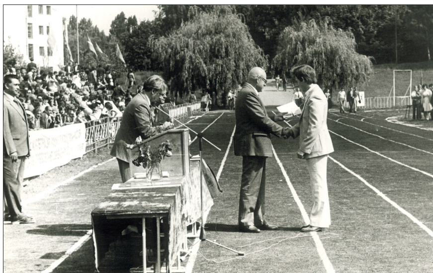
Ректор И. В. Кузьмин вручает дипломы выпускникам ВПИ