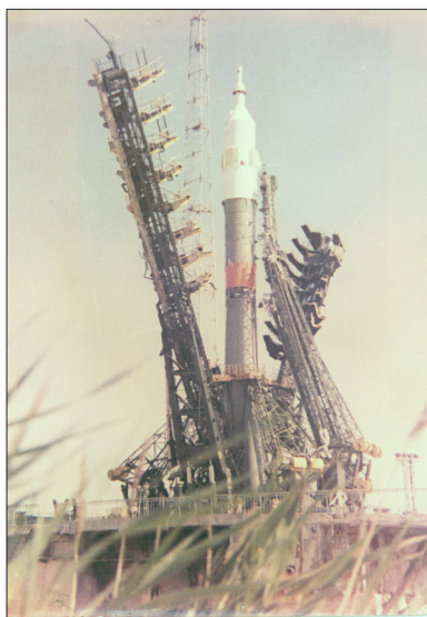
Байконур, перед пуском Р-7. 1999 г.