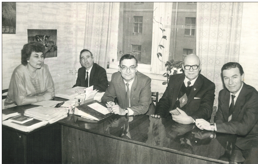
Среди сотрудников кафедры системотехники ХНУРЭ, г. Харьков