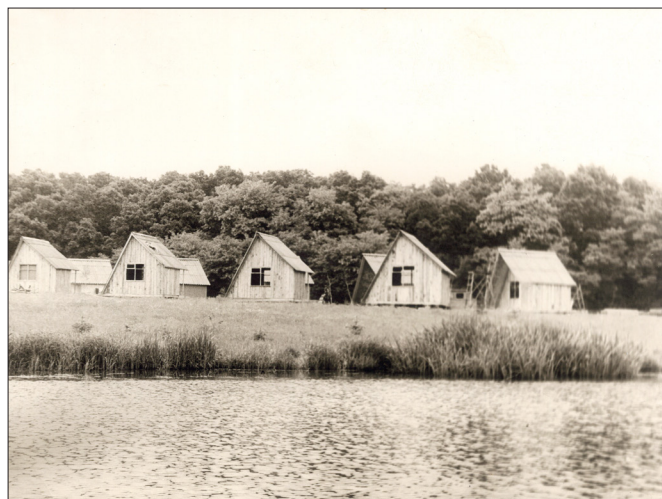
Спортивно-оздоровительный лагерь «Степашки», построенный под руководством И. В. Кузьмина на р. Южный Буг в 1977 г.