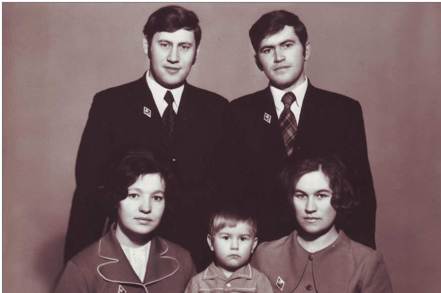
Брати Георгій та Олександр з молодими дружинами. м. Омськ, 1973 р.