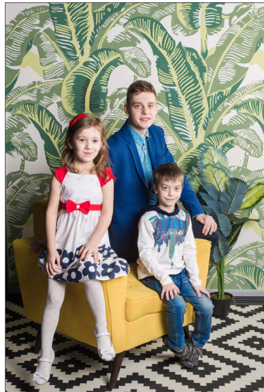
Дорогі серцю діти та онуки