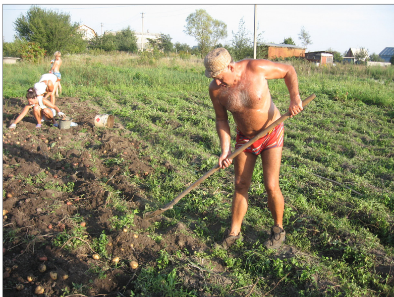
Збирання гарного врожаю, 2006 р.