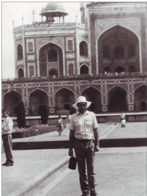
Прогулянка по Індії, 1987 р.