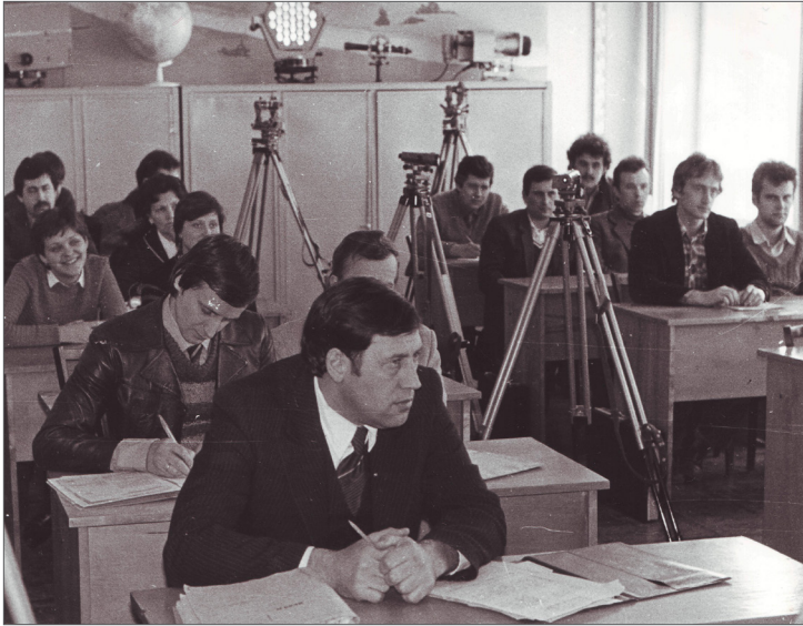
Методичний семінар. ВПІ, 1982