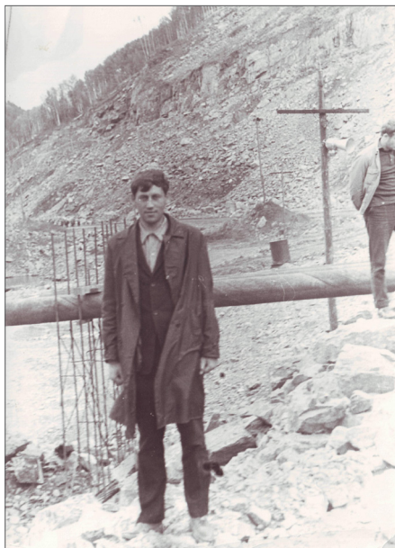
На будівництві Саяно-Шушенської ГЕС, 1972 р.