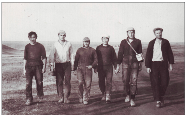
Під час проведення геодезичних робіт. м. Тольятті, 1969 р.