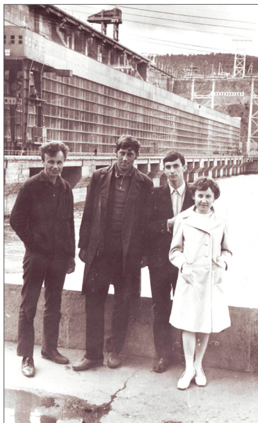
Екскурсія зі студентами на Красноярську ГЕС. м. Дивногірськ, 1976 р.