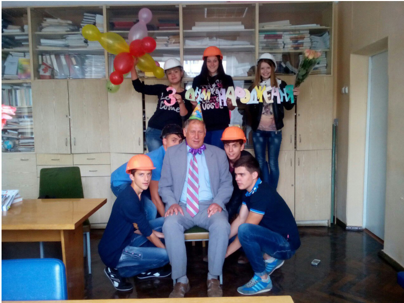
Студенти-будівельники вітають улюбленого декана з днем народження