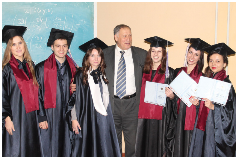
Вручення дипломів магістрам-будівельникам