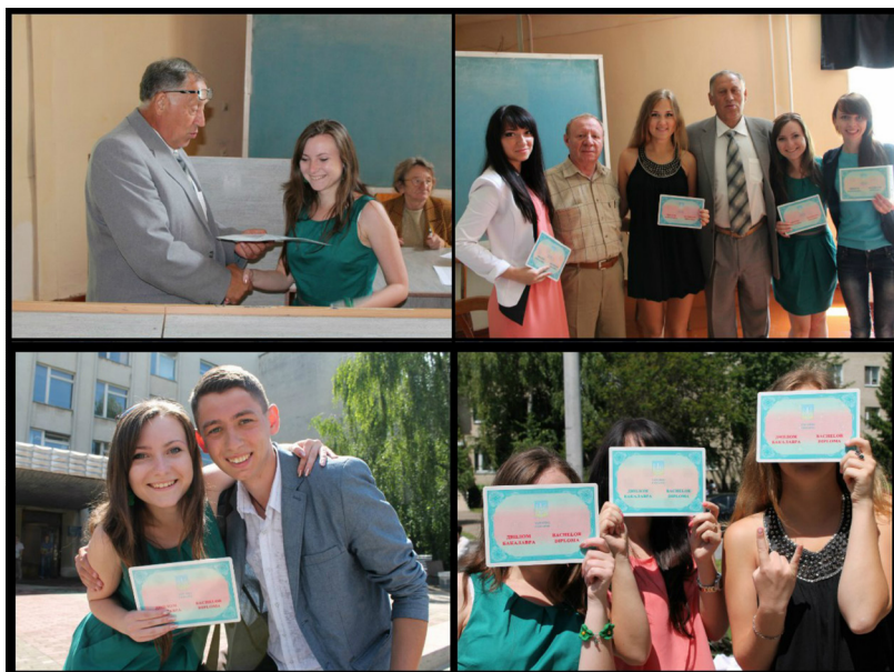
Фото на згадку з «новоспеченими» фахівцями будівельної справи. ВНТУ, 2014р.