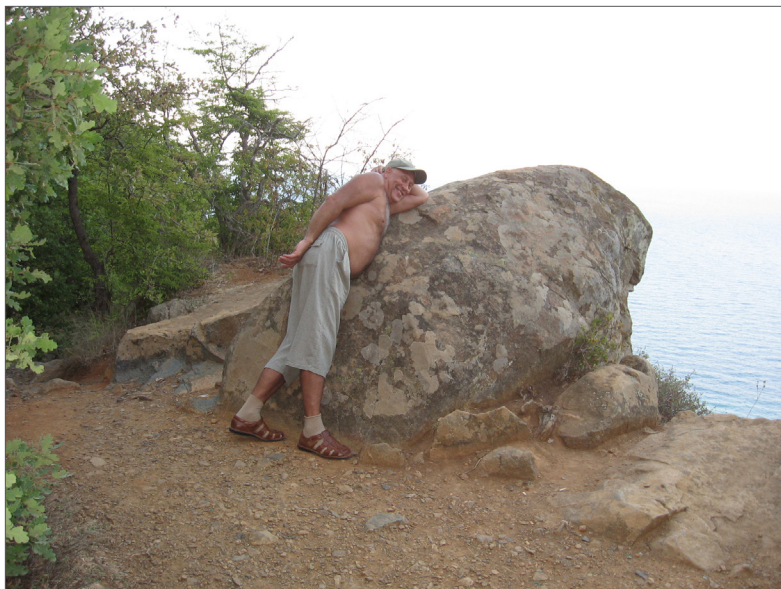
Підкорення гори Аю-Даг. Крим, 2007 р.