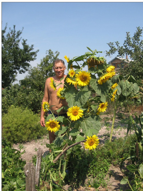
Улюблена рослина, 2005 р.