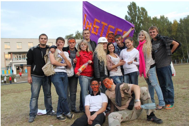
Команда факультету будівництва – чемпіон ВНТУ з футболу